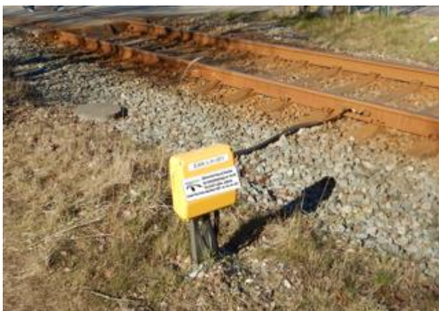
Mærkning for akseltæller, siddende på EAK-boks

Disse må ikke håndteres som beskrevet i denne tekniske meddelelse, uden en forudgående aftale.