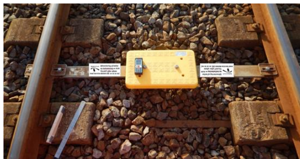
Mærkning for balise, siddende på Vortok beslag