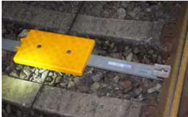
Eksempel på balise monteret på skinner mellem 2 sveller

Balisen er monteret på en Vortok bar som er fastgjort via et beslag der klemmer om den frie skinnefod mellem 2 sveller.